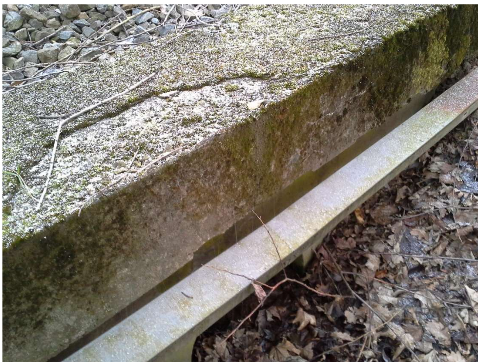
Foto 4: Detailní pohled na římsu propustku s odlupujícím se betonem a porostlou vegetací (mech)